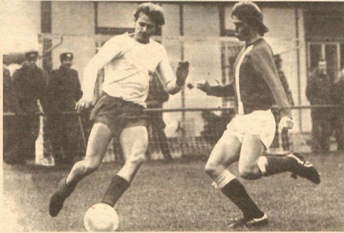
Der Erfurter Winter (rechts) — hier im Zweikampf mit Müller vom 1. FC Union Berlin — gehörte zu den besten Spielern des FC Rot-Weiß Erfurt, doch die erste Auswärtsniederlage in dieser Saison konnte er auch nicht verhindern.