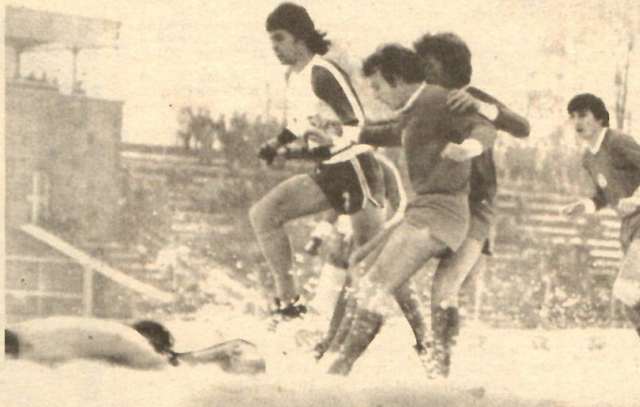
Winter im Zwickauer Georgi-Dimitroff-Stadion! Doch der 1. FCM ließ sich davon nicht beeindrucken, machte „sein“ Spiel und gewann 2:1. Retter in höchster Not gegen Pommerenke ist wiederum Torhüter Croy. Vier Zwickauer sind chancenlos.

Schiedsrichterkollektiv: Riedel (Berlin), Peschel (Radebeul), Siemon (Halle); Zuschauer: 4 500; Torfolge: 1:0 Kühn (29.), 2:0 Altmann (55.). — Torschüsse: 17:10 (8:5); verschuldete Freistöße: 15:17 (6:8); Eckbälle: 13:5 (11:5); Verwarnung: Sorge (wegen Reklamierens).